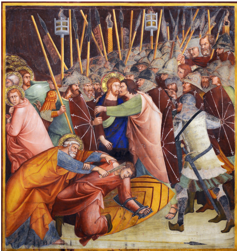
Barna di Siena, Judaskyssen , 1350-talet, fresk, Collegiata di Santa Maria Assunta, San Gimignano, Bild: Wikipedia, Creative Commons: https://creativecommons.org/licenses/by-sa/4.0/ .