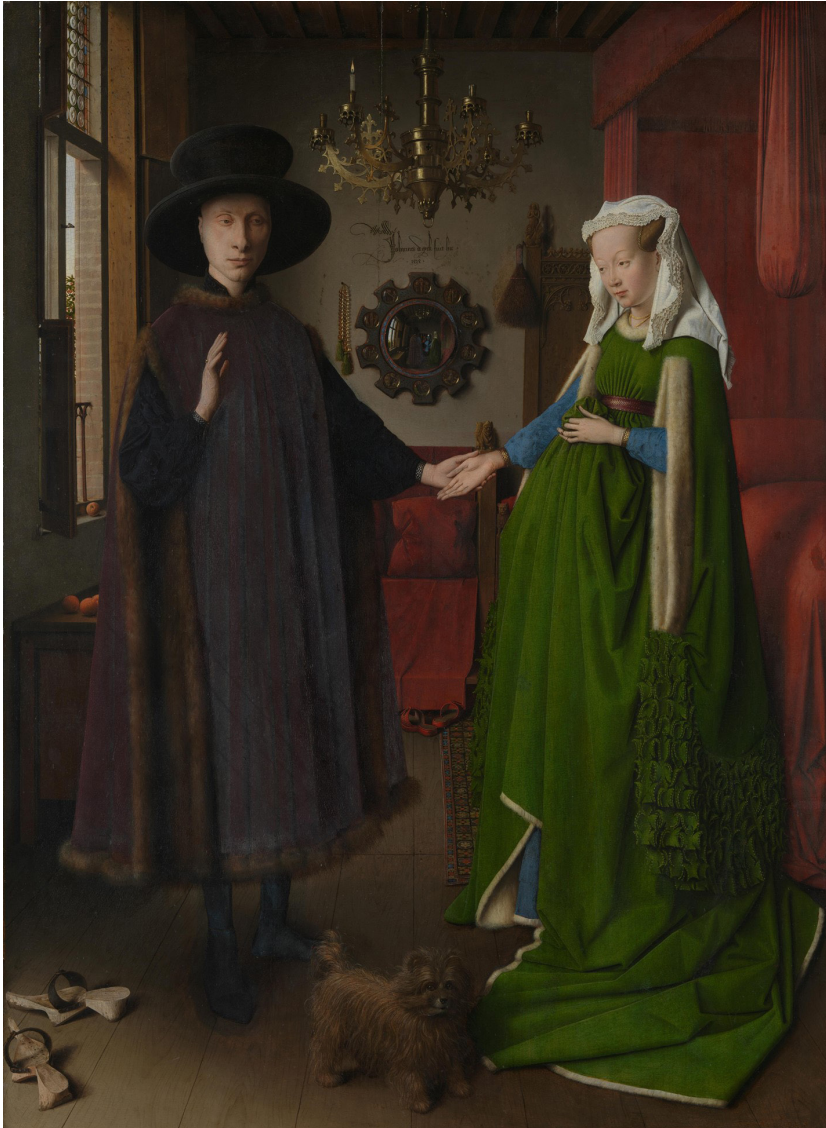
Jan van Eyck, Arnolfiniporträttet , 1434, olja på ekpanel, National Gallery, London.