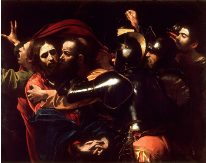
Michelangelo Merisi da Caravaggio, Judaskysssen , olja på duk, 1602, National Gallery of Ireland, Dublin.

1602. Här är själva inramningen en helt annan. Caravaggio avbildar bara sju individer och trädgården i Getsemane är helt höljd i dunkel, vilket för vår uppmärksamhet mot de avbildade individerna och deras realistiska anletsdrag. Figurerna dras framåt i bilden vilket både för dem närmare betraktaren och varandra. Judas och Jesus relation mänskliggörs genom deras respektive ansiktsuttryck (sorg och lidande blandat med förskräckelse hos Jesus, respektive ångerfull uppgivenhet hos Judas) på ett sätt som tycks vara menat att gestalta någonting allmänmänskligt. Judas svek blir här en betraktelse över sveket som sådant och därmed direkt av intresse för oss som betraktare oavsett historisk kontext (vilket också accentueras av att Caravaggio låtit avbilda soldaterna med 1600-talsuniformer). Känslan av att vi här blir upplysta, eller instruerade, i förräderiets fenomenologi förstärks när vi inser att den enda källan till ljus i målningen är en lykta som