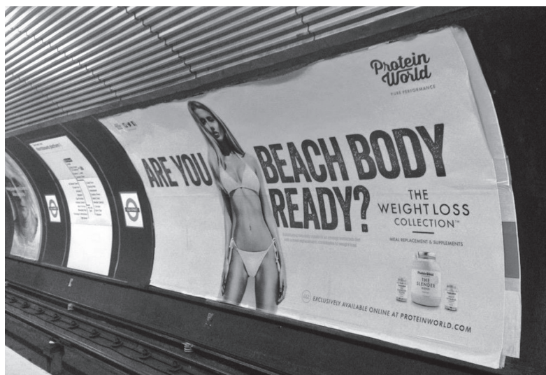
Figur 22.1. Protein Worlds strandkroppskampanj.

förbudet? Och finns det någonting kvar att säga om bilderna och kampanjen som kroppsaktivisterna inte redan sagt?