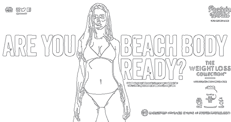
Figur 22.3. Är din kropp redo för stranden? (Min stilisering av originalet).

1989). Men hur förhåller det sig med modellens blick? Blick är, som konstateras av Theo van Leeuwen (2008: kap. 8), ett sätt att etablera symbolisk kontakt med åskådaren. En blick som riktar sig rakt mot åskådaren kan signalera självförtroende, familjaritet eller i vissa kulturer aggressivitet; en nedåtvänd blick eller blick som vänder sig bort från åskådaren kan signalera underkastelse eller svaghet. Modellen intar en självsäker pose: hon är lättklädd, skjuter fram höfterna och faller tillbaka axlarna (tillbaka till steg 1). Hennes ögon, däremot, är knappt skönjbara: de döljs i skuggor, saknar skärpa och hindrar därmed att hon ställer ”krav” på åskådarens status (steg 2). Blicken är robotlik, mystisk, inte helt mänsklig. Hon är i den bemärkelsen en post-feministisk avatar (steg 3). Hon är sexuellt frigjord, utstrålar fysiskt självförtroende och signalerar att hon är stolt över sin kropp, men finns bara till för att konsumeras. Hon ställer inga politiska krav på social förändring och tar inte ställning mot ojämlika maktförhållanden.