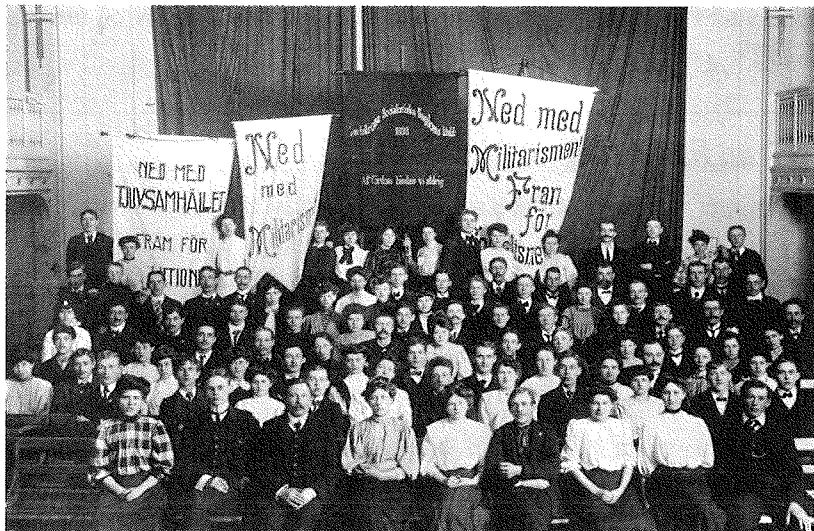
Den ungsocialistiska klubben i Landskrona tillhörde de mer radikala klubbarna i landet. På denna bild syns medlemmarna med antimilitaristiska standar.

avtackades i såväl fosterlandets som arméns namn. Uppropet överskred gränsen för ett acceptabelt beteende med råge.