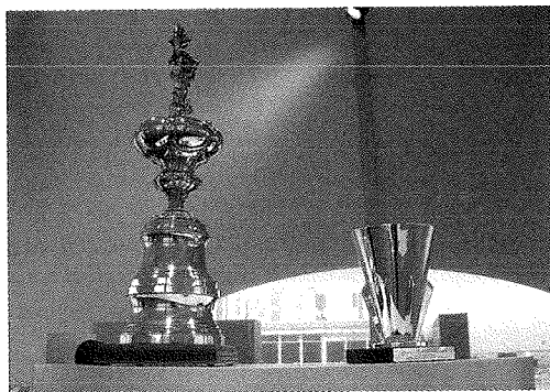
Första gången America's Cup-tävlingarna och prispokalen kom till Europa.

Som vi kommer att se i den empiriska analysen nedan, behöver Öresundsregionen emellertid inte vara en plats inom vilken gränser upphört att existera. Tidigare forskning har visat att regionaliseringen färgas av olika nationella intressen. 62 I linje med detta menar Hall, Sjövik & Stubbergaard att Öresundsintegrationen präglas av ett tänkande strukturerat utifrån territoriella gränsdragningar, snarare än att globalisering och transregionalisering leder till att sådana skiljelinjer förlorar sin betydelse. 63 Även Richard Ek lyfter fram vad han kallar för »territoriellt grundade Öresundsregionala konfliktlinjer«, såsom exempelvis de vilka förekommer mellan Köpenhamn och Malmö/Skåne, mellan södra och norra delen av Öresund samt mellan västra och östra Skåne. 64