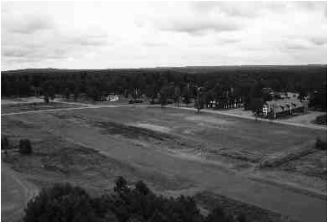
Slätten breder ut sig över ett par hektar stort område i centrala Skillingaryd. Området har använts som exercisfält sedan 1600-talet, men idag brukas det sparsamt.