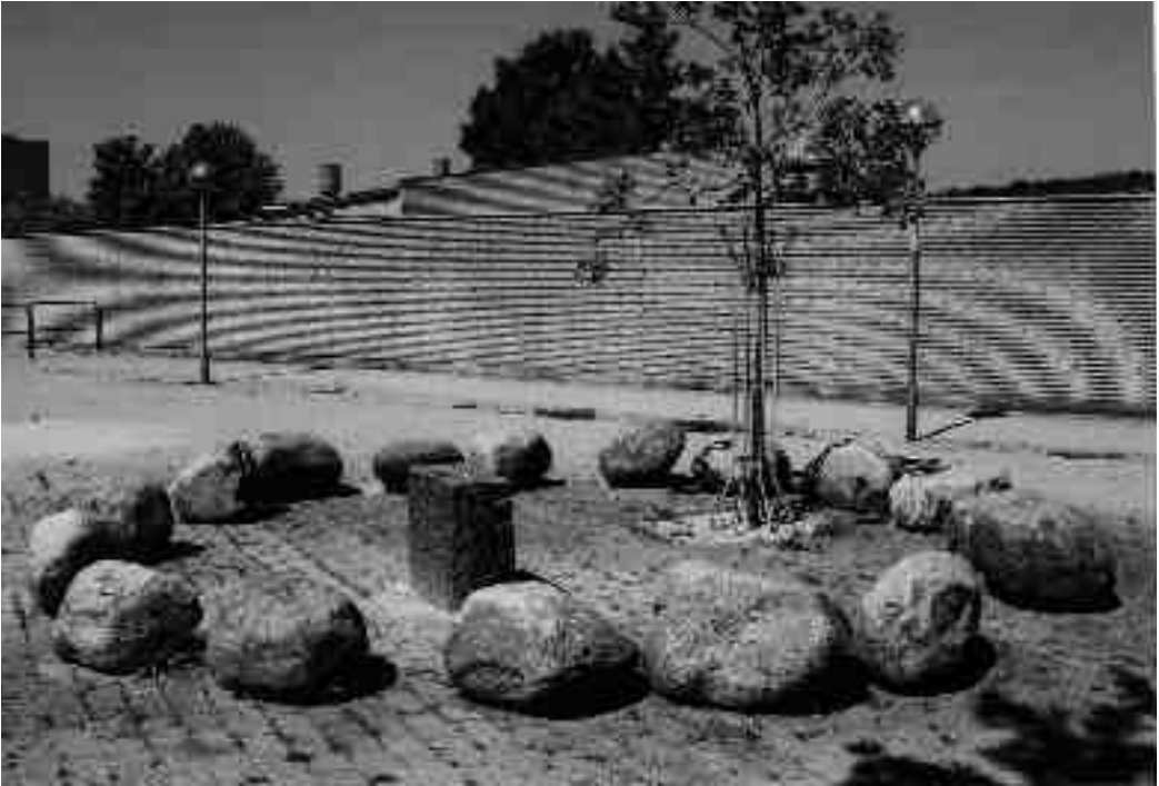
Fig. 3. Mindesmærke ved findestedet for Frydenhøjsværdet på Avedøre i Hvidovre.