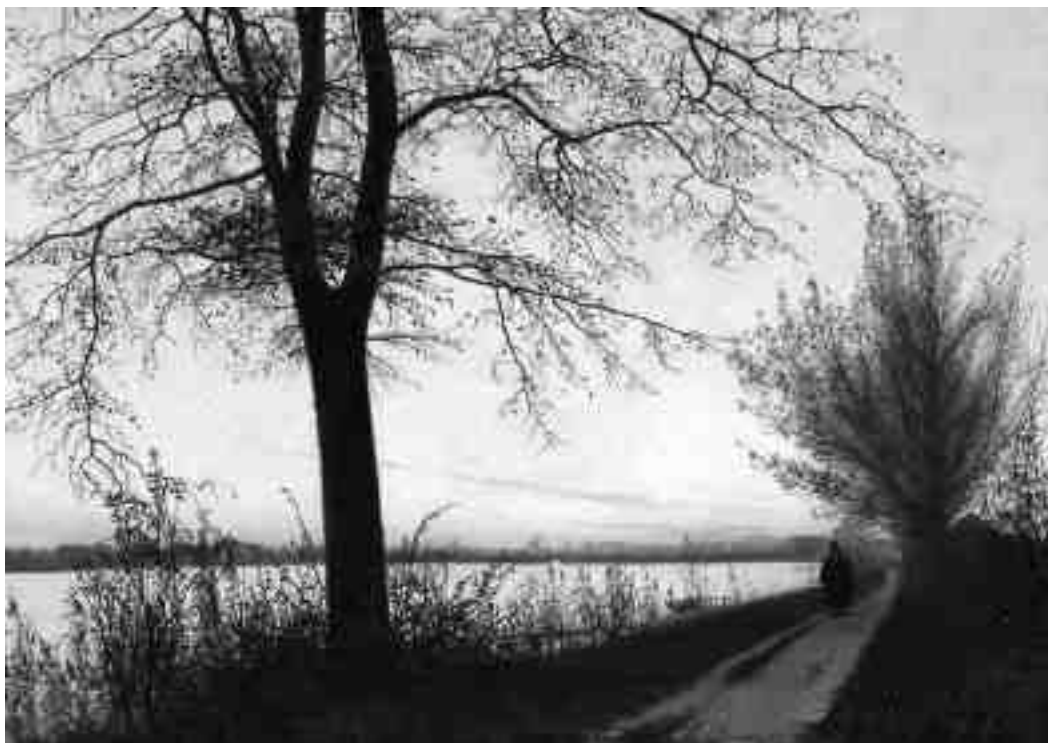
Efterårs morgenen ved Sortedamssøen, 1838, malet af Christian Købke (1810–1848). Udsigt mod datidens København i baggrunden. Ny Carlsberg Glyptotek, København.

maler Louis Gurlitt var blevet udnævnt til ridder af Dannebrog i 1847, blev bl.a. hans landskabsmalerier fjernet fra Det kongelige Billedgalleri. Han blev ellers regnet for en af de bedste skildrere af det danske landskab, 18 og han var medlem af Kunstakademiet i København. Han faldt imidlertid i unåde på grund af det stadigt tiltagende modsætningsforhold mellem dansk og tysk i perioden fra slutningen af 1830'erne, udspillet over forholdet mellem Slesvig og Holsten. Her valgte han frihedskæmpernes – set fra en dansk synsvinkel: oprørernes – side i 1848. Landskabsmaleriet var da for længst blevet et instrument i den nationale ideologis tjeneste. Skønt Gurlitt opfattede sig som dansk og under et besøg i München i 1839 skrev til sine forældre i Altona i Holsten (på tysk):