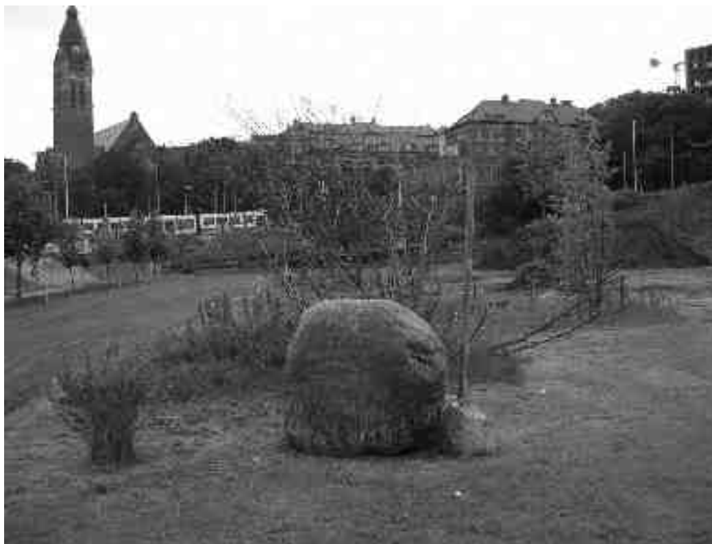
Figur 4. Carlsrofältet som förråd år 2007.

också noteras att förutom som förrådsplats har Carlsrofältet vid återkommande tillfällen använts av IFK Göteborgs supporterklubb, exempelvis då något jubileum skall firas. Senast samlades man på platsen under hösten 2003 för att inleda firandet av supporterklubbens 30-årsjubileum och platsen uppmärksammades också i samband med IFK Göteborgs 100-årsjubileum, som ägde rum hösten 2004.