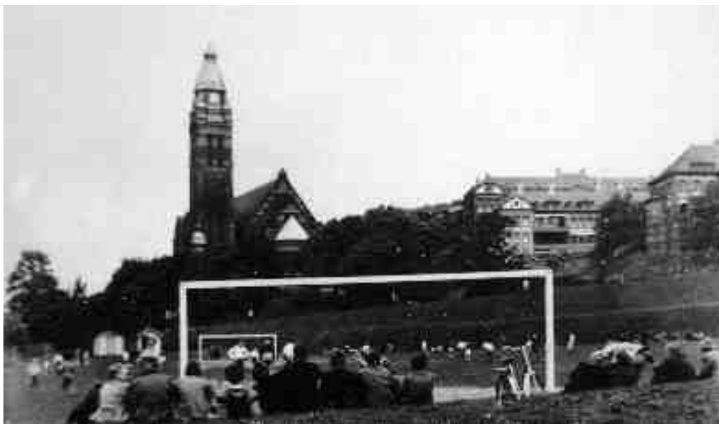
Figur 2. Carlsroffältet år 1949.

för IFK Göteborg och dess supporterklubb som passat på att resa en minnessten på platsen. Minnesmärket fungerade som en ensam grindstolpe till parkeringsplatsen och riskerade att ramponeras av de otaliga bilar som varje morgon trängde sig in på parkeringsplatsen.