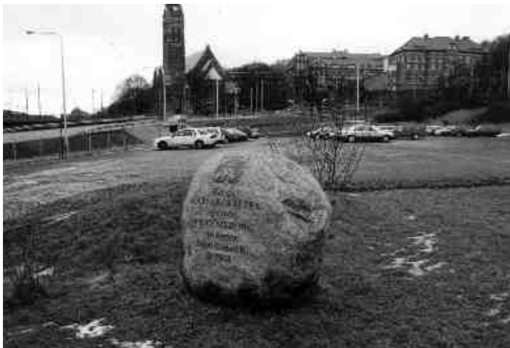
Figur 3. Carlsrofältet som parkeringsplats år 2002.

är en idrottshistorisk plats som fram till 2002 användes och brukades för sitt ursprungliga syfte. Redan av det skälet är en fortsatt användning som fotbollsplan angelägen och betydligt mer befogad än den nuvarande användningen som förrådsutrymme. Här blir det dessvärre tydligt att kulturarvsförvaltningens praxis fortfarande avslöjar en ignorant inställning till folkliga – däribland fotbollens – kulturarv. Även de nya resonemangen om brukande i stället för bevarande motverkas i detta fall. De nya vindarna har uppenbarligen ännu inte nått in i de ansvarigas korridorer i Göteborg, där en äldre och traditionell syn på vad som skall betraktas som kulturarv och därmed värt att bevara som en del av vårt kollektiva minne tycks dominera.