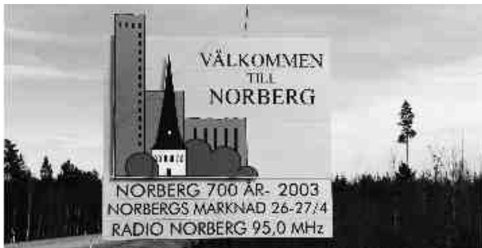
Den nyuppsatta skylten som hälsar välkommen till Norberg och som förutom skogen och kyrktornet också visar den tidigare så omdebatterade laven.

Efter en lång tid av diskussion beslöt kommunledningen att ta över laven i syfte att bevara den. Den renoverades delvis och användes bland annat som scen för experimentell teater och musik. I början av 2000-talet möts därför en bilist på väg mot Norberg fortfarande av vyn med granskogen, kyrktornet och laven. Det är nu inte allt. Vid vägkanten finns också en skylt som hälsar välkommen till orten och skylten visar en stiliserad bild av skogen, kyrktornet – och laven. Vad hände på vägen från de upprörda röster som förespråkade en omedelbar rivning av det man betraktade som »skit«, som något fult och farligt, till välkommandet av resenärer med just denna siluett? Hur kunde laven få officiell sanktion som en positivt laddad fysisk miljö, som signalerar stolthet och tillhörighet?