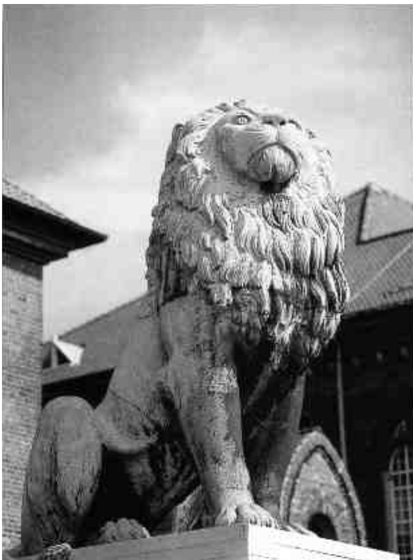
Istedløven, til minde om slaget ved Isted 25. juli 1850, blev skabt af den slesvigsk fødte billedhugger H.V. Bissen. Den blev som mindesmærke for de danske faldne i Treårskrigen og som en markering af de nationalliberale storhedsdrømme rejst 1862 på en kirkegård i Flensborg. Efter nederlaget 1864 førtes løven til Berlin, men blev i 1945 bragt til København, hvor den med en placering ved Tøjhusmuseet i offentligheden står som et minde om dengang, »vi vandt over Tyskland«.