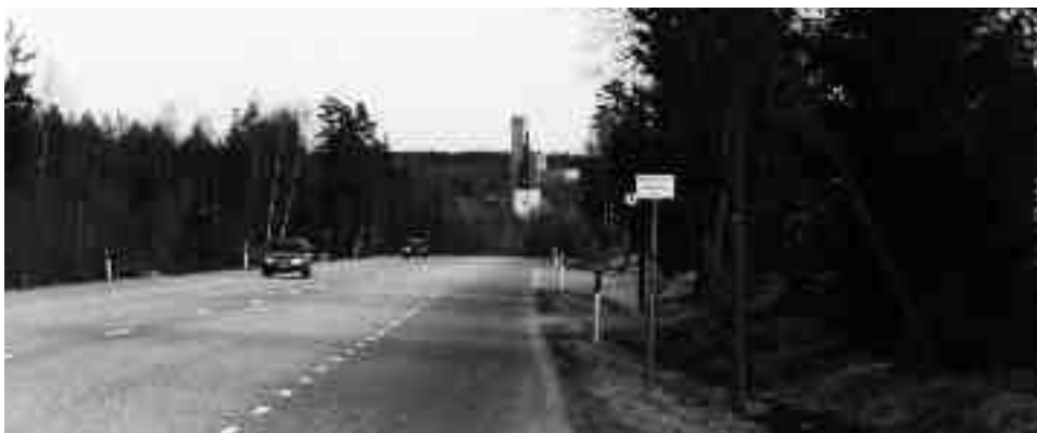
Norberg sett söderifrån med kyrktornet och laven som höjer sig ur skogen.

Den som kommer körande söderifrån och närmar sig det svenska gruvsamhället Norberg möts av en anslående vy. Ur den täta granskogen höjer sig ett kyrktorn och en lave. Laven är aningen högre än kyrktornet. I Norberg finns ett stort antal lavar eftersom orten har en lång historia av malmbrytning; en lave svarar för den avgörande funktionen att transportera upp malmen ur gruvan. Den höga, ljusa betonglave som syns från vägen byggdes på 1960-talet och är den senaste i raden. När Norberg i likhet med många andra orter drabbades av järn- och stålindustrins omfattande rationaliseringar på 1970- och 80-talen förlorade laven sin funktion och lämnades tyst och övergiven. Efter en tid började den förfalla och med dess centrala placering i samhället invid ett bostadsområde, blev den snart betraktad som en potentiell fara.