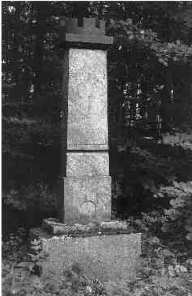
Mindestøtte over Ulrik Christian Gyldenløve, der var søn af Christian 4. og Vibeke Kruse. Han udmærkede sig under svenskekrigene, og murkronerne skal minde om det belejrede København. Jægerspris Mindelund er det eneste sted med adskillige mindesmærker for svenskekrigene.

Bortset fra de to mindestøtter over fyrster fortæller alle øvrige om bemærkelsesværdige personer i dansk og norsk historie. Det er en stor og broget flok borgere og adelsfolk fra Danmark, Norge og Island samt enkelte udlændinge, som her bliver mindet: søhelte, statsmænd, historikere, naturvidenskabsmænd, digtere, præster, missionærer og pædagoger. I alt er der 82 navne på mindestøtterne, udvalgt med hovedvægt på perioden 1500–1750. Fra middelalderen er der kun syv navne, mens der fra 1500-, 1600- og 1700-tallet er et rigt udvalg med tyngdepunkter omkring reformationen, Københavns belejring og enevældens indførelse. Selvom det ikke er krigsbedrifter, der dominerer, så deler søhelte dog ikke mindsten med andre, mens histori-