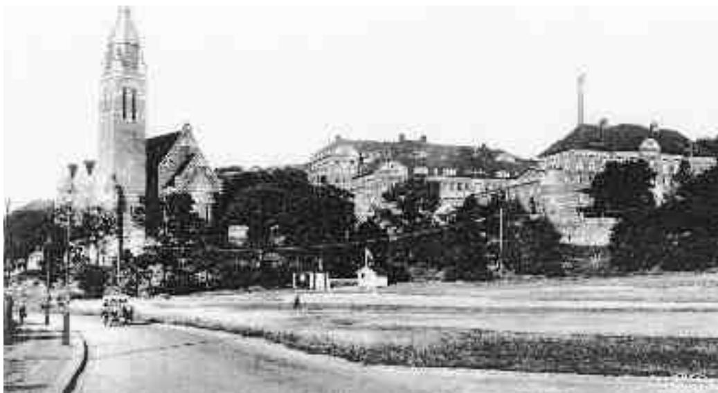
Figur 1. Carlsrofältet 1930-tal.

Under perioden 2002–2004 användes platsen dock som parkeringsplats, vilket var något överraskande för de kringboende som en morgon helt oväntat vaknade av att ett antal lastbilar vräkte av makadam och grus på planen. Detta var även helt oväntat