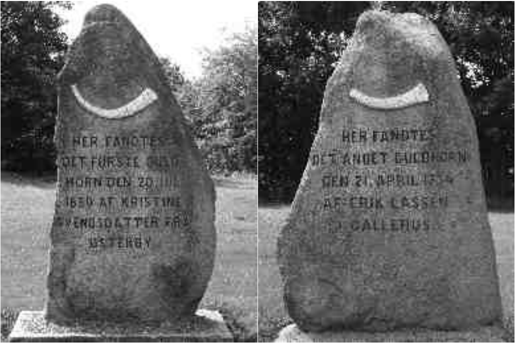
Fig. 2 a–b. Mindesten i Gallehus for fundet af Guldhornene.

Mindesmærkerne er rejst gennem det meste af 1900-tallet med et tydeligt tyngdepunkt i 1930'erne og 1940'erne. Det bemærkes, at ingen nye mindesmærker etableres i 1970'erne og 1980'erne. For at være mere præcis: Mellem rejsningen af en træstolpe i 1968 ved fundstedet for Tollundmanden og en mindesten rejst i 1992 ved fundstedet for Vekshøjhelmene sker intet. Kronologien for mindesmærkerne over arkæologiske fund synes her helt at følge tendensen for andre mindesmærker med 1930'erne og 1940'erne som højdepunkter.