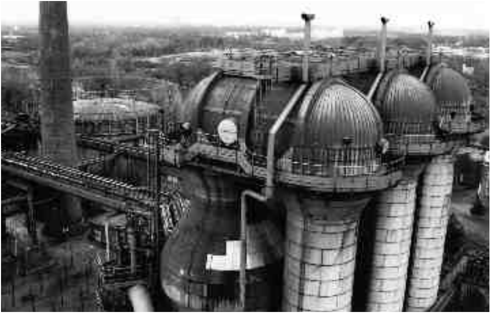
Landschaftspark Duisburg-Nord, utsikt från masugnskransen.

av slagghögar markerades promenad- och cykelstigar och i en kraftstation byggdes en restaurang. Kvällstid lyste en ljusinstallation upp området i starka färger. Området tilläts växa igen men även medvetna planteringar har gjorts. Begreppet Industrienatur och ett estetiserande bildspråk användes för att uppvärdera den industriella igenväxningen och bidrog så till platsens nya definition som landskapspark.