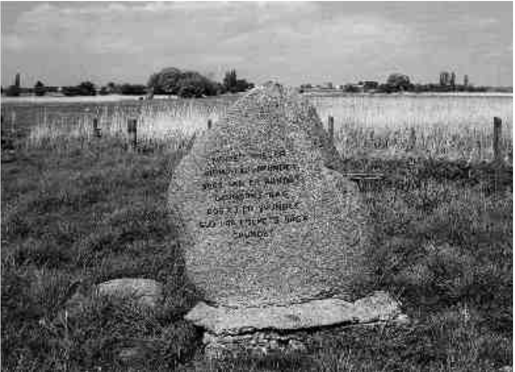
Fig. 4. Mindesten i Mullerup Mose.

desmærkerne blev rejst med dansk indskrift over danske guldhorn fundne af danskere i det dengang tyske land. Paradoksalt er stenene dog hentet i det urtyske Harzen.