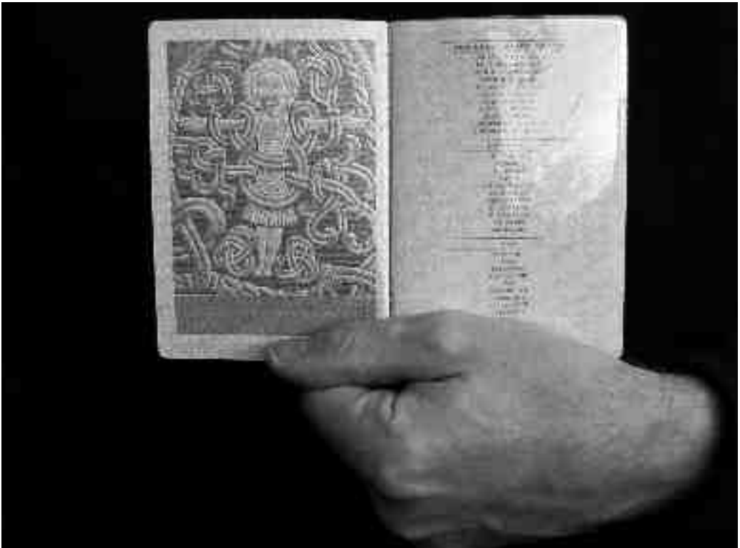
Fig. 5. Mit danske pas med Jellingestenens Kristusfigur.