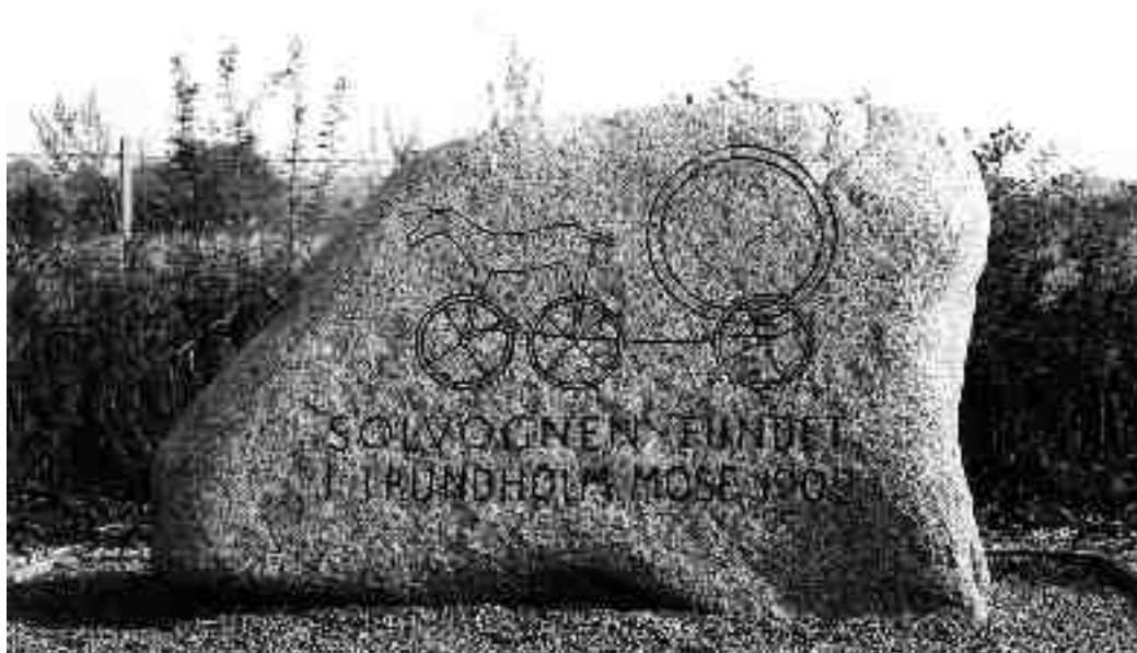
Fig. 1. Mindesten nær findestedet for Solvognen i Trundholm Mose.

landskabet. Mindesmærket glider ind i glemsel sammen med findestedet.