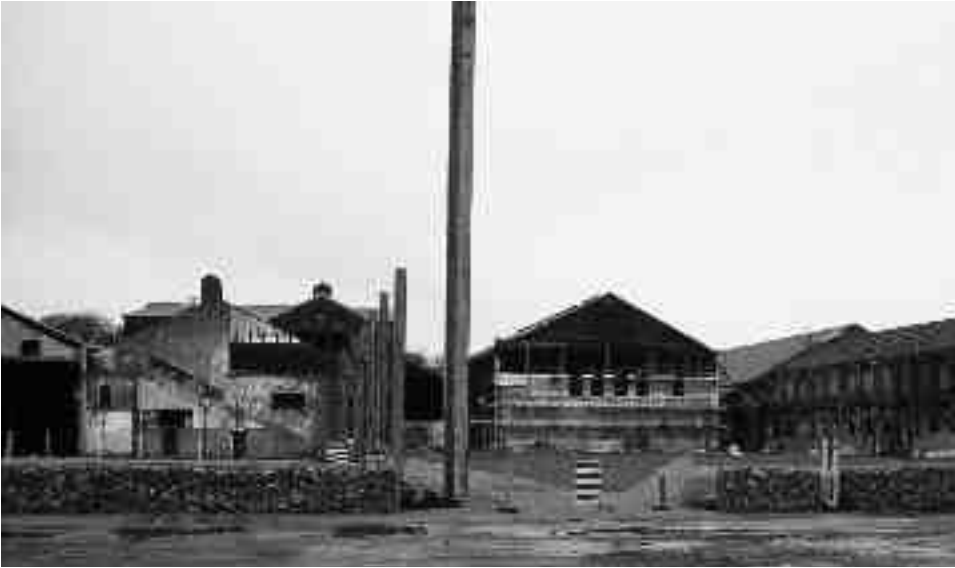
Sparade spår efter att en verksbyggnad rivits. Från vänster en mångfärgad kortvägg, en rad med I-balkar och låga murar byggda av tegel från rivningen. Till höger en slaggstensbyggnad som senare omvandlades till kontor.

– karaktäriserades som unika i jämförelse med andra platser i Sverige och i andra länder. Jämförelsen blev ett led i en lokal argumentation som motiverade varför offentliga medel skulle investeras i att renovera och iordningställa ett gammalt industriområde centralt i staden, lokaliserat mellan centrum och Dalälven.