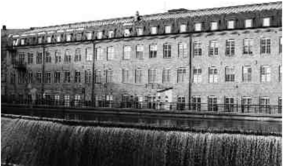
Vattnet som tidigare var en kraftkälla och transportmöjlighet har fått ny ekonomisk betydelse som faktor i skapandet av god livsmiljö. Illustration från Norrköping.

byggelse, exempelvis den industriella. 7 En internationell organisation för bevarande av industriella miljöer skapades 1973 och ett stort antal konferenser och publikationer såg dagens ljus. Trots det måste det industriella förflutna i början av 2000-talet fortfarande karaktäriseras som en styvmoderligt behandlad kategori inom kulturarvsprofessionen, inkorporerad i kanon men på intet sätt placerad i dess centrum. Orsaken kan sannolikt sökas i hur kostsamt och komplicerat det synes vara att översätta befintlig kulturarvspraktik till att gälla också stora, ofta farliga och svårbegripliga industrimiljöer.