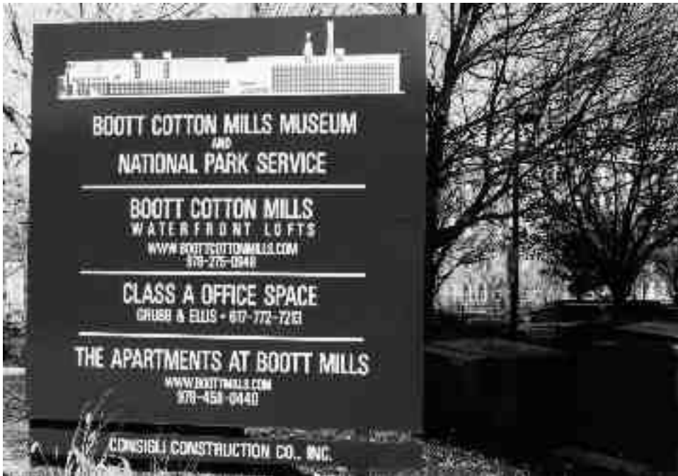
Reklam för lägenheter och kontor i ombyggda textilfabriker i Lowell, Mass., USA.

Inom stadsplaneringen började den överblivna industriella bebyggelsen betraktas som en ekonomisk resurs i Sverige i början av 1980-talet. De föregående decenniernas omfattande rivningar av stadskärnor hade mött protester och skapat ett intresse för återanvändning. 8 Ett decennium tidigare hade konstnärer börjat använda övergivna fabriker i storstäder som New York till kombinerade ateljéer och boendemiljöer. Ganska snart blev »loft living« en trendig bostadsform för en övre medelklass och den industriella arkitekturen värderades högt. 9 I slutet av 1900-talet var omvandlade industri- miljöer nära vatten eftertraktade boendemiljöer. Magasin, kvarnar och textilfabriker i städer runt om i Europa och USA har blivit lägenheter och kontor som marknadsförs med hjälp av rostiga balkar, råa betongväggar, stora fönster och högt i tak.